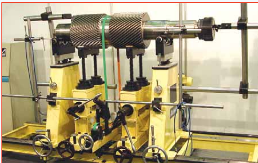
Рис. 3. Балансировочный станок VM-3000

режим прогрева ротора на станке, требуемый для стабилизации состояния ротора при длительном хранении, а также не требует строгого горизонтирования ротора при его укладке на станок. Эта высокотехнологичная конструкция, является уникальной разработкой компании "ДИАМЕХ 2000", содержит целый ряд высокоточных элементов и обеспечивает высокую точность уравнивания (рис. 3).