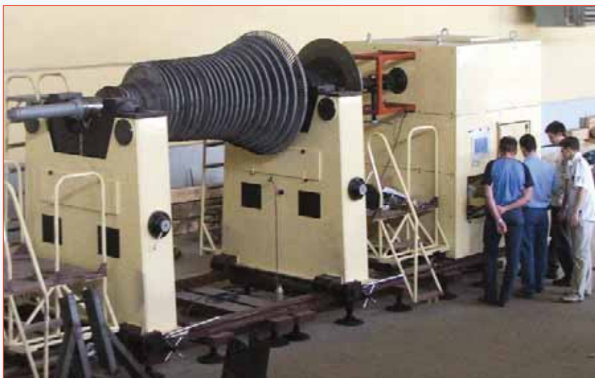
Рис. 1. Балансировочный станок ВМ-36000 грузоподъёмность 40 т

Всем этим требованиям удовлетворяют балансировочные станки серии ВМ, разработанные и производимые серийно российским предприятием "ДИАМЕХ 2000", основанным в 1989 г. Серийное производство балансировочных станков было начато в 1995 г. с модели ВМ-3000 грузоподъёмностью до 3000 кг. Всего на данный момент было реализовано более 900 станков 16-и моделей, из которых 30 станков грузоподъёмностью 40...90 т (рис. 1).