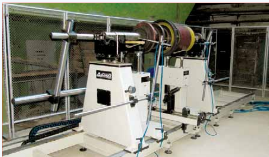
Рис. 4. Балансировочный станок VM-8000

Несмотря на единство конечной цели - уравнивание ротора, т.е. совмещение главной центральной оси инерции ротора с его осью вращения путём установки корректирующих грузов или снятия массы, станки двух типов имеют принципиальные различия в методиках балансировки.