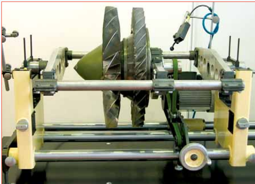
Рис. 5. Балансировочный станок VM-050 со специальной оснасткой