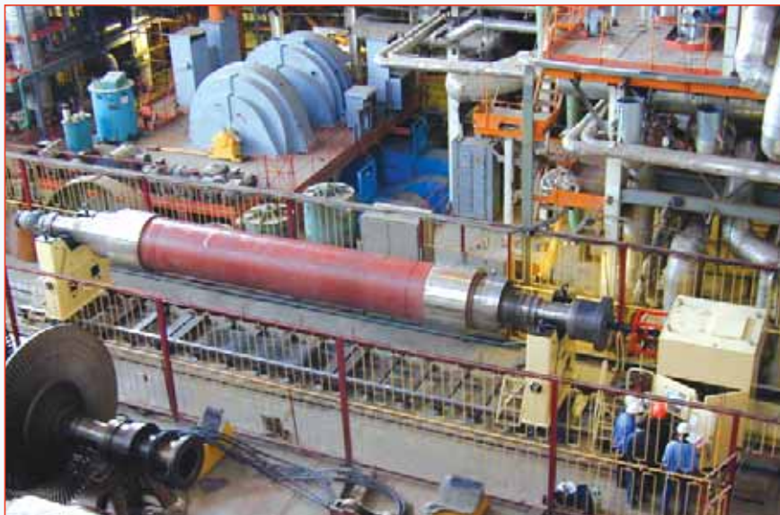
Рис. 2. Балансировочный станок VM-90000 во время балансировки ротора генератора на электростанции

режим прогрева ротора на станке, требуемый для стабилизации состояния ротора при длительном хранении, а также не требует строгого горизонтирования ротора при его укладке на станок. Эта высокотехнологичная конструкция, является уникальной разработкой компании "ДИАМЕХ 2000", содержит целый ряд высокоточных элементов и обеспечивает высокую точность уравнивания (рис. 3).