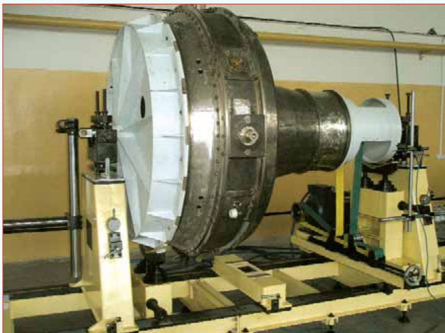
Рис. 6. Балансировочный станок VM-3000 со специальной оснасткой

Методика балансировки на жёстких станках предусматривает обязательную процедуру калибровки опор станка эталонным ротором для минимизации инструментальной погрешности станка, а балансировочные грузы вычисляются по геометрическим параметрам ротора. Это и обеспечивает простоту настройки станка перед балансировкой, но увеличивает методическую погрешность, обусловленную отличием эталонного ротора от реального объекта балансировки. В процессе эксплуатации происходят различные негативные процессы, которые приводят к изменению жёсткости опорных стоек, меняются параметры различных электронных компонентов. Поэтому производители станков с жёсткими опорами настоятельно рекомендуют приобретать вместе со станком средства калибровки - дорогостоящие эталонные роторы и хотя бы раз в год, а лучше перед каждой ответственной балансировкой выполнять поверку (аттестовывать) станки этими роторами, а для обеспечения точности выполнять калибровку.