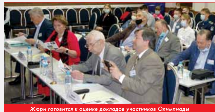
Жюри готовится к оценке докладов участников Олимпиады