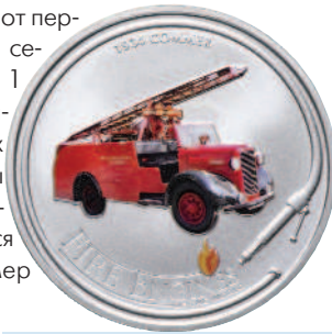
Острова Кука 2005 1 доллар Пожарная машина Commer