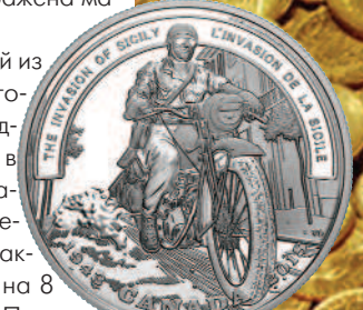
Канада $20 сицилийская операция