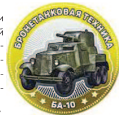
РФ 10 рублей бронетанковая техника БА-10