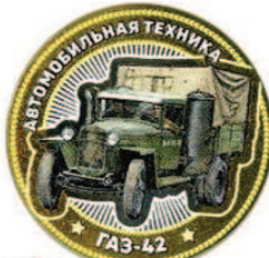
РФ 10 рублей ГАЗ 42 на газогенераторе

Так "Чифтэн" (вождь) была разработана канадской ком-