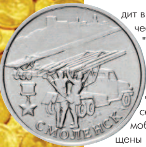
РФ 2 рубля 2016, город-герой Смоленск Катюша, БМ-13