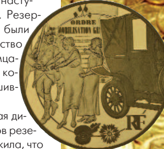
Франция 50-евро-2014-марнское такси