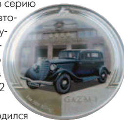
Ниуэ 2 долл 2008 Газ М-1 "Эмка"