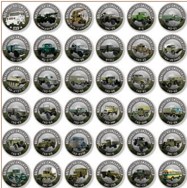
Россия. Коллекционные жетоны: автомобили военного назначения