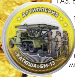
РФ 25 рублей 2016 Катюша БМ-13