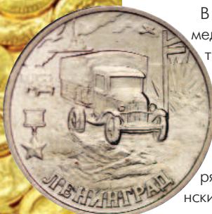
СССР 2 рубля город герой Ленинград, "Дорога жизни" ГАЗ-АА