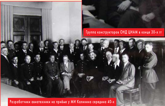
Разработчики авиатехники на приеме у МИ Калинина середина 40-х