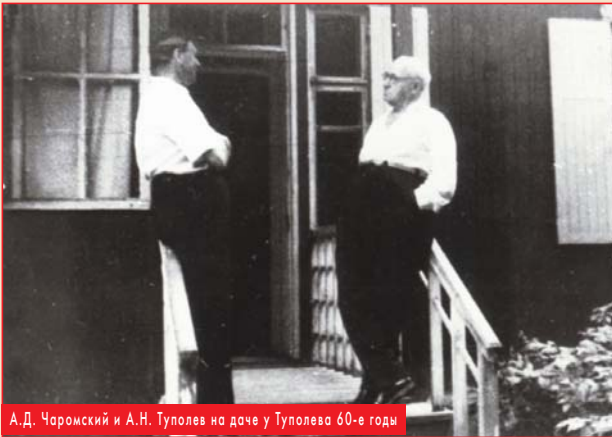
А.Д. Чаромский и А.Н. Туполев на даче у Туполева 60-е годы