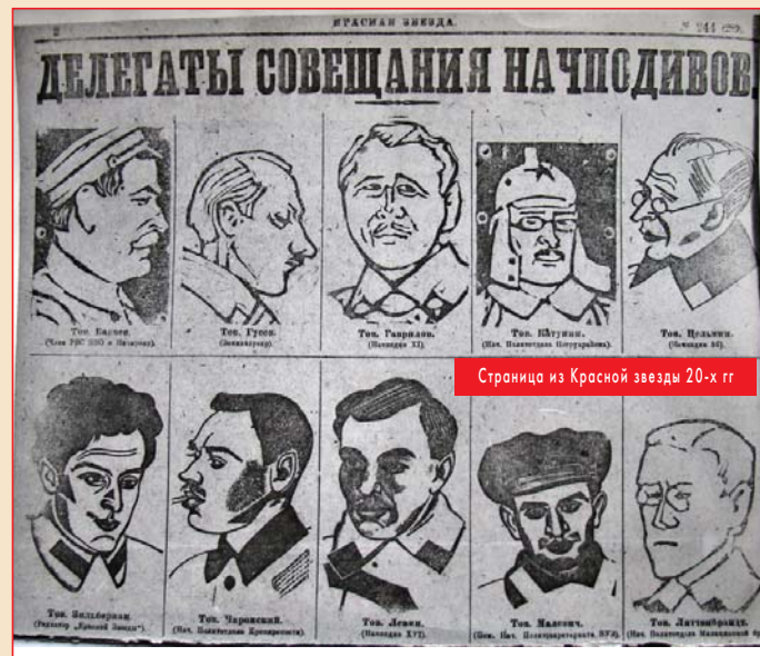
Страница из Красной звезды 20-х гг