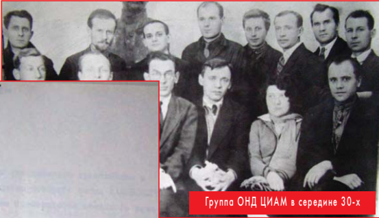
Группа ОНД ЦИАМ в середине 30-х