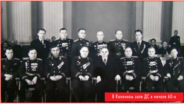
В Колонном зале ДС в начале 60-х