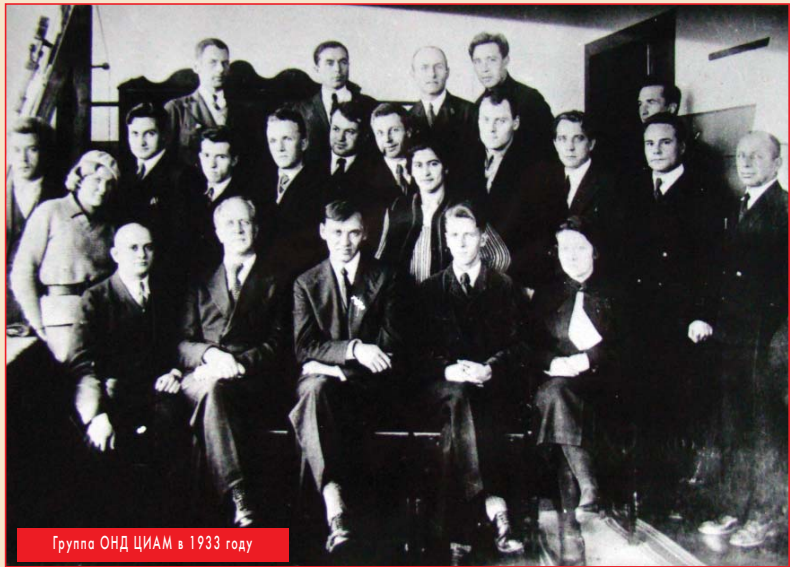
Группа ОНД ЦИАМ в 1933 году