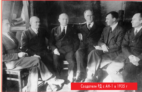
Создатели РД с АН-1 в 1935 г.