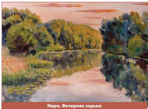
Нара. Вечерняя зорька