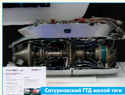
Сатурновский ГТД малой тяги