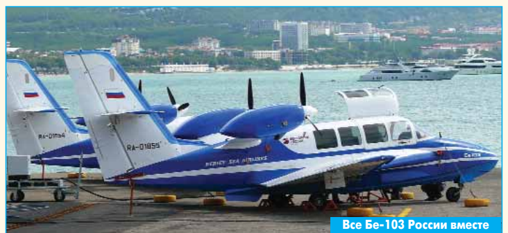
Все Be-103 России вместе