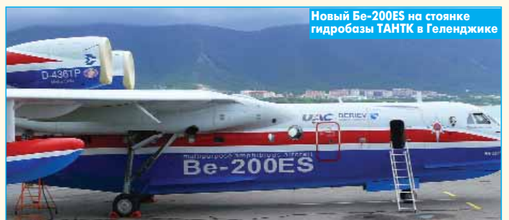
Новый Be-200ES на стоянке гидробазы ТАНТК в Геленджике