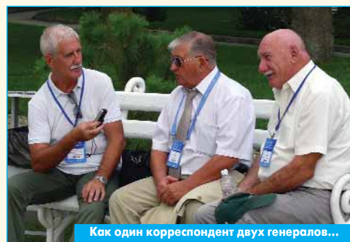
Как один корреспондент двух генералов...

На полях "Гидроавиасалона-2018" прошёл ряд мероприятий кадровой и профориентационной направленности. Так, "Объединенная авиастроительная корпорация" провела форум перспективного кадрового резерва. Состоялась презентация создаваемых в Геленджике детских центров планерного, парусного и водно-моторного спорта "Авиастарт", "Алые паруса" и "Формула будущего". Для того, чтобы максимально увеличить детскую аудиторию салона, организаторы выставки сделали вход ребят в возрасте до 14 лет бесплатным. За четыре дня салон посетили более 3,5 тыс. детей, пришедших как с родителями, так и в составе организованных групп.