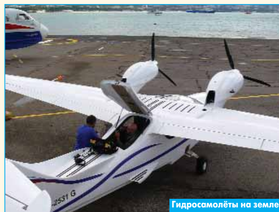
Гидросамолёты на земле