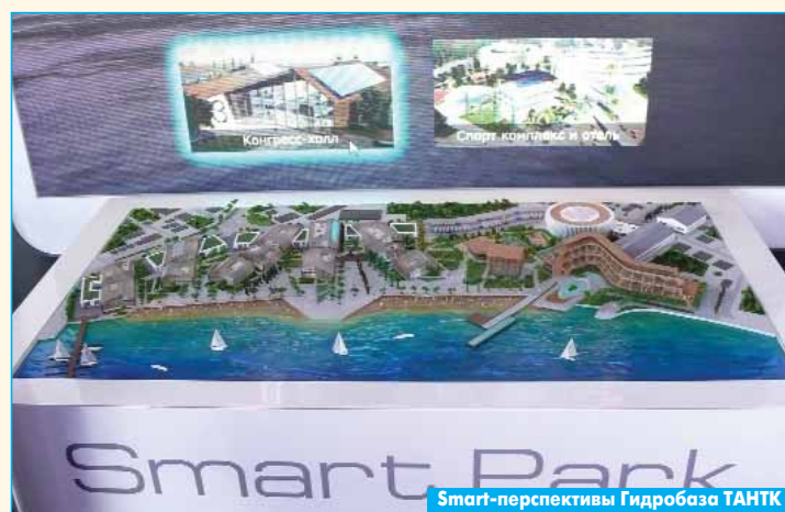
Smart-перспективы Гидробаза ТАНТК