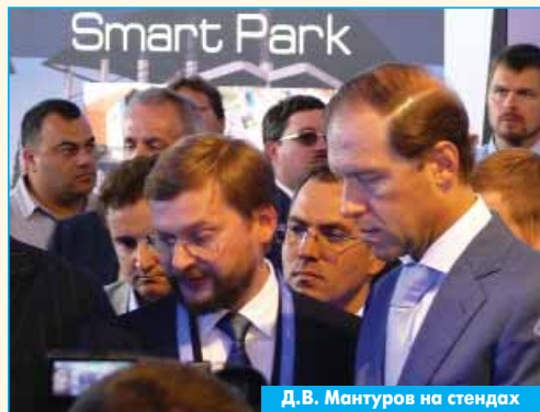
Д.В. Мантуров на стендах

завершила свою работу поистине с рекордными показателями: 203 компании-участника, самая масштабная деловая программа, крупные сделки на поставку более чем 180 самолётов и вертолётов. За четыре дня выставку посетило 26,4 тыс. человек. Работу мероприятия освещал 321 журналист. Информационное обеспечение выставки в этом году осуществляло АО "Авиасалон", знакомое нам по МАК-Сам. Мероприятие 2018 года не имеет аналогов и по числу новаций в деловой программе.