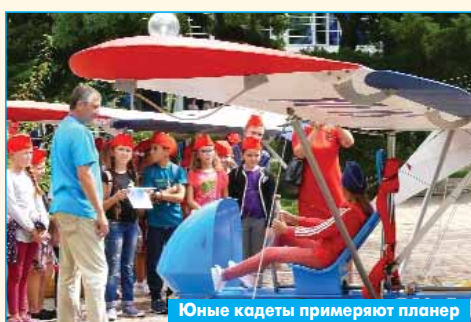
Юные кадеты примеряют планер

Программа полётов, как и ожидалось, вызвала восторженную реакцию зрителей. В небо над Геленджикской бухтой поднялись пилотажные группы "Стрижи" и "Первый полет". Спортсмены показали совершенно роскошный пилотаж на поршневых машинах, ранее не демонстрировавшихся здесь. Демонстрационные полёты выполнили самолёты-амфибии Бе-200ЧС и Бе-103, легкомоторные летающие лодки, вертолёт.