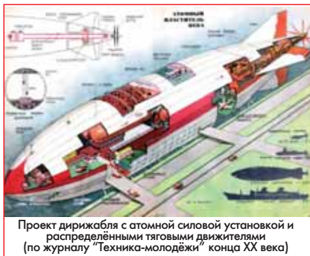
Проект дирижабля с атомной силовой установкой и распределёнными тяговыми двигателями (по журналу "Техника-молодёжи" конца XX века)

Заметим, кстати, что история изобретательства явно замыкает некий виток: первыми двигателями (не считая мускулолётов), которые пытались применить на летательных аппаратах ещё в XIX веке, наряду с паровыми, были электрические. И изобретатели оставили попытки их применения - как выяснилось, на время - в связи с появлением работоспособных двигателей внутреннего сгорания: поршневых, а после и газотурбинных.