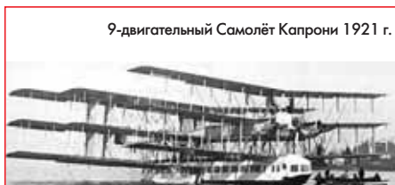
9-двигательный Самолёт Капрони 1921 г.