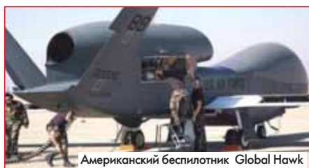
Американский беспилотник Global Hawk

тывающие электроэнергию для этих двигателей. Некоторые из этих моделей находятся на грани пилотируемых и беспилотных летательных аппаратов. Впрочем, последнее - пока экзотика.