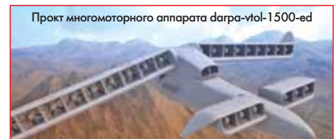
Проект многомоторного аппарата darpa-vtol-1500-ed