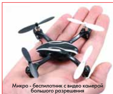
Микро - беспилотник с видео камерой большого разрешения

С другой стороны, уже не один десяток лет разрабатывается тема электроракетных двигателей различного класса: ионно-плазменных, на ячейках Холла и иных конструкций. Эти двигатели работают