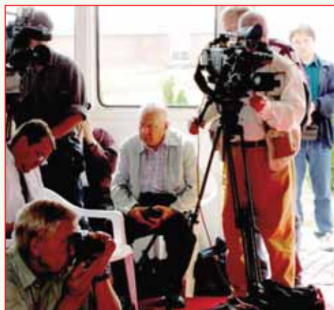
На пресс-конференции перед МАКС-95

и нас, которых тогда ещё не было на свете, соучастниками событий, давно ушедших и многими забытых. Человек, всегда имевший собственную точку зрения на те вопросы, которыми он занимался как специалист. И не то что не боявшийся спорить с сильными и руководящими, но умевший убеждать всех в своей правоте и делавший всех своими сторонниками. А работать ему приходилось с разными - и весьма непростого характера - людьми. Он, умевший прощать ошибки и естественные человеческие слабости людям, которых любил и уважал - а он умел понимать людей и выбирать среди них тех, с кем можно идти по жизни рядом. Хотя и ему были свойственны и ошибки, и слабости: как и всякому человеку. И ещё: сохранивший уникально чёткую память до конца дней. И в ней все были живы, деятельны и прекрасны в своей человеческой неидеальности.