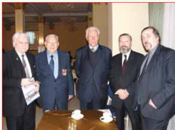
На заседании клуба Авиаторов