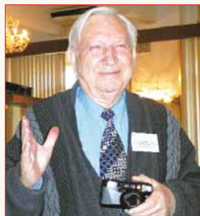
На заседании АССАД