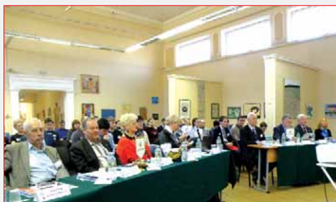
Жюри приготовилось к работе

Далее, в соответствии с проведённой накануне жеребьёвкой, участники представили свои доклады.