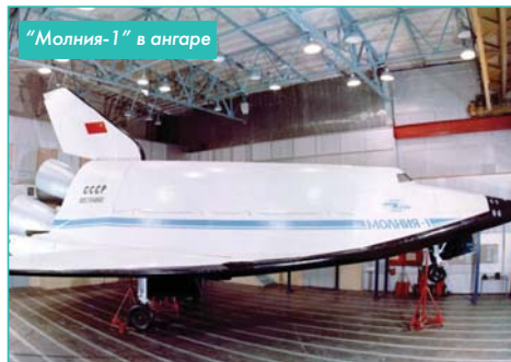
«Молния-1» в ангаре