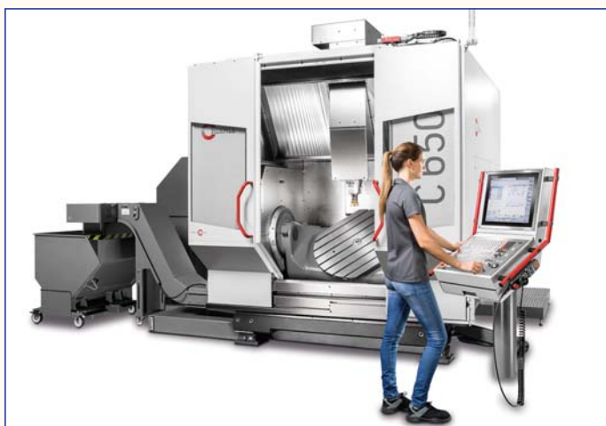
Новый обрабатывающий центр С 650 серии Performance-Line

Сайт представительства: www.hermle-vostok.ru