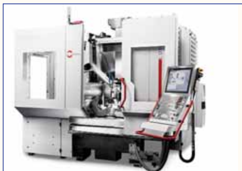
Роботизированная система RS 05, установленная на обрабатывающем центре С 12 U Dynamic