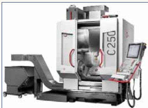
Станок С 250 серии Performance-Line

Сайт представительства: www.hermle-vostok.ru