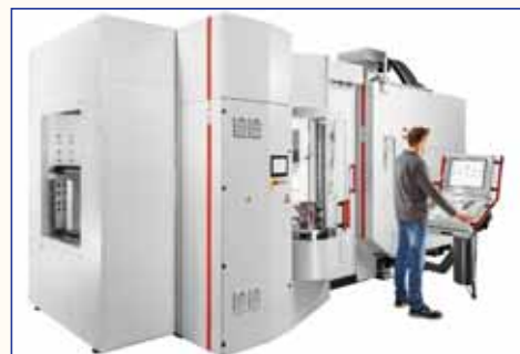
Манипуляционная система HS flex, установленная на 5-осевом обрабатывающем центре С 42 U