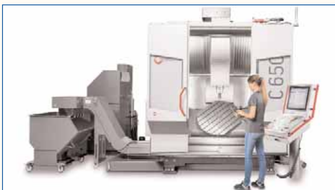
Обрабатывающий центр С 650 с наклонно-поворотным столом с ЧПУ Ø 900 x 750 мм

Традиционно в работе выставки приняла участие и компания Hermle. На этот раз была представлена новая модель станка С 650 серии Performance-Line производства компании Maschinenfabrik Berthold Hermle AG. Станок С 650 - это новый обрабатывающий центр для самых различных операций 3-х и 5-осевой обработки. Возможности станка - прецизионная точность и высокие эксплуатационные характеристики - были наглядно продемонстрированы при изготовлении стального штампа для производства инструментов и форм на предприятиях автомобилестроения.