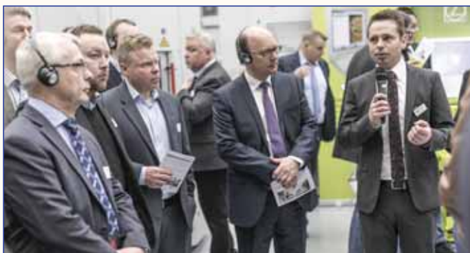
Специалист предприятия проводит производственную экскурсию