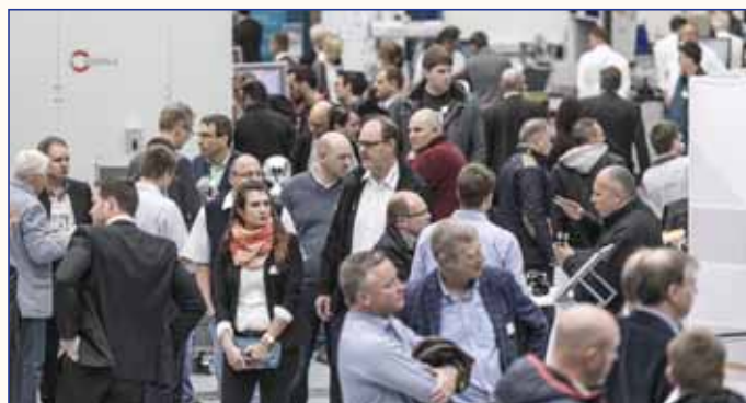
Участники и гости выставки Open House 2017 на фирме Hermle