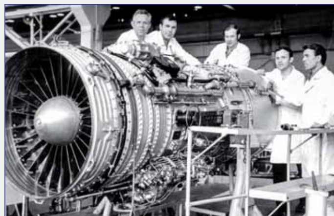
В сборочном цеху у двигателя Д-30