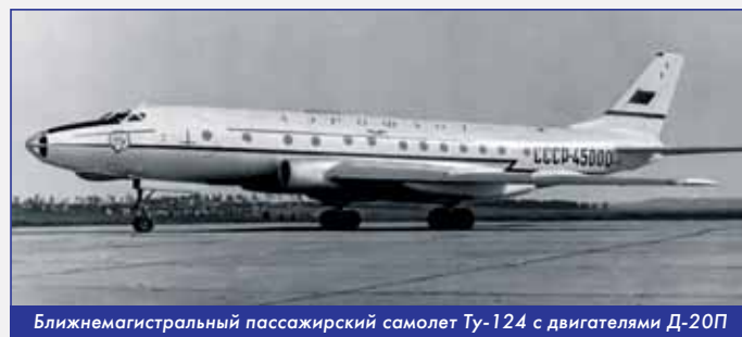
Ближнемагистральный пассажирский самолет Ту-124 с двигателями Д-20П

Двухконтурная схема двигателя, занимая промежуточное положение между ТРД и ТВД, позволяла значительно улучшить эконо-