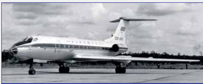
Ближнемагистральный пассажирский самолет Ту-134 с двигателями Д-30

Выбор в 1955...1956 годах размерности 7 и 8 ступенчатых компрессоров двигателей Д 20 и Д 20П позволил, не меняя размерности группы базовых ступеней, создать в будущем семейство авиационных ТРДД с тягой от 5.5 до 17.5 тс и промышленных ГТУ мощностью от 2.5 до 25МВт. Незначительному моделированию (на ~1% по диаметру)