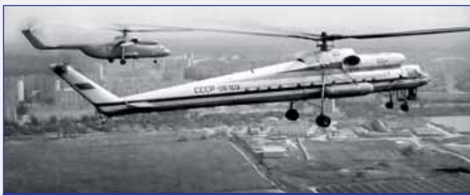
Военный транспортный вертолет Ми-10 и вертолет Ми-6 с двигателями Д-25В

мичность ТРД за счет меньших потерь с выходной скоростью, улучшить газодинамическую устойчивость компрессорной высоконапорной системы за счет естественного перепуска за КНД во второй контур, уменьшить уровень шума и тепловыделения в гондолу, а по сравнению с ТВД позволяла иметь менее сложную конструктивную схему и большую надежность за счет отсутствия редуктора и поворотных лопастей винта, большую крейсерскую скорость полета, меньшее акустическое воздействие на планер и местность.