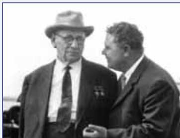
С Туполевым Внуково, июнь 1963 года

При этом нужно признать как неоспоримый факт, что создание авиационных моторов является одной из самых наукоемких, труднейших и ответственных сфер человеческой деятельности, ибо авиационный мотор, соответствующий сути своего предназначения, где все работает на пределе - это "сгусток энергии", вбирающий при своем создании все наивысшие достижения человеческого интеллекта во множестве разделов науки и технологий: это термо- и газовая динамика, горение и прочность при высочайших нагрузках, металлургия, теория механизмов и автомати-