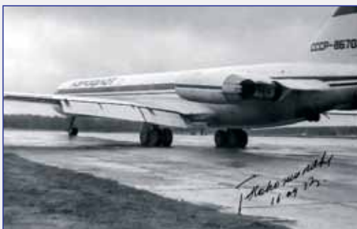
Дальнемагистральный пассажирский самолет Ил-62М с двигателями Д-30КУ

- применение сразу высоких параметров цикла, в частности температуры газа перед турбиной T_{CA}=1330...1430 К.