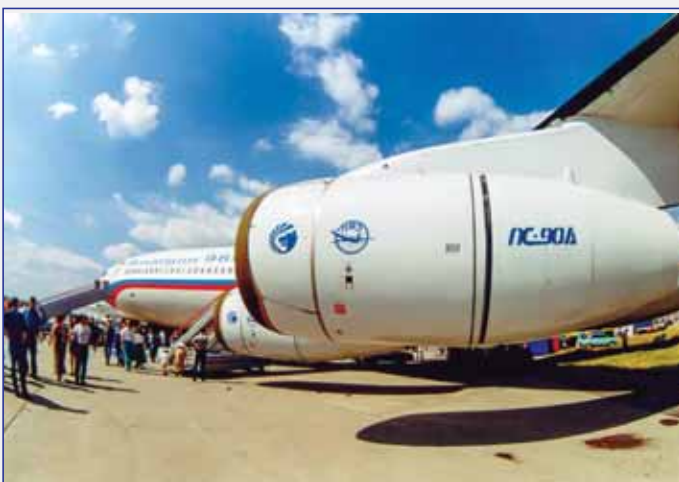
Самолет Ил-96М с двигателями ПС-90А

В процессе поузловой доводки на специальных стендах было проведено большое количество автономных испытаний большинства узлов и их основных деталей. На начало 1985 года в ПМКБ было задействовано около 65 экспериментальных установок.