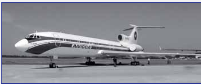
Среднемагистральный пассажирский самолет Ту-154М с двигателями Д-30КУ-154

Первый полет состоялся 5 июня 1957 года, серийное произво-