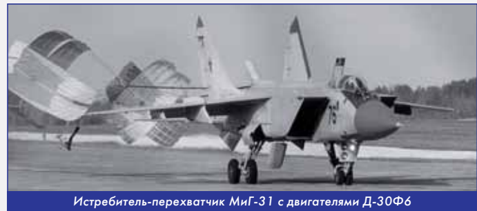
Истребитель-перехватчик МиГ-31 с двигателями Д-30Ф6