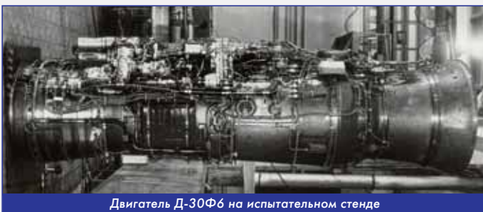
Двигатель Д-30Ф6 на испытательном стенде