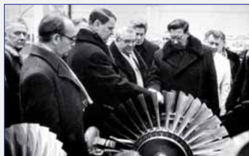
На опытном заводе

Особое место как объект, на котором был установлен двигатель Д 30КП с тягой 12 тс, занимает военно-транспортный самолет Ил 76 - его основные модификации Ил 76ТД и Ил 76МД. Всего было выпущено около 1000 экземпляров, из которых примерно 400 - для ВВС.