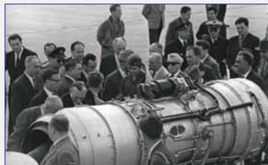
Двигатель Д-20П Внуково 11 июля 1963 года

Вертолетная силовая установка с двигателем Д 25В была создана за еще более короткий срок - 8 месяцев и в 1959 г. запущена в серийное производство. Указанные короткие сроки создания